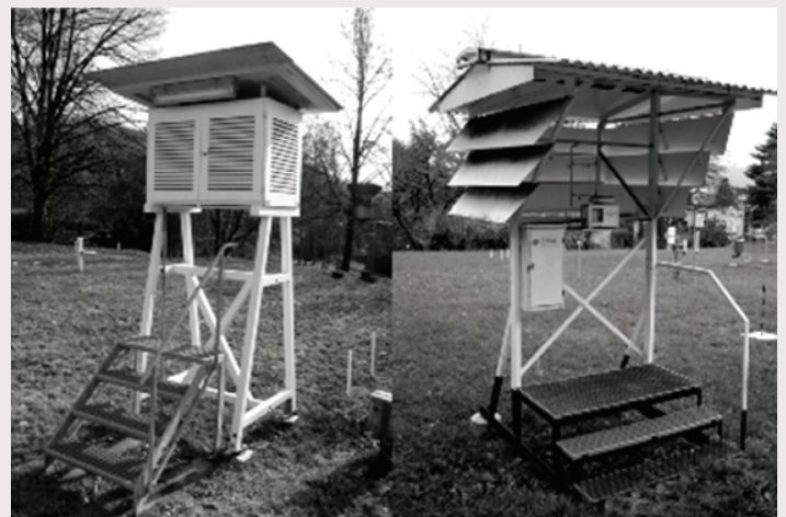
Un abri Stevenson typique et un ancien abri français prenant des mesures en parallèle dans un observatoire à Basel, en Suisse.

particulières sont basés sur le climat local et les questions les plus intéressantes portent sur les biais systématiques à grande échelle découlant des transitions qui ont eu lieu dans de nombreuses régions. Par exemple, le recours aux abris Stevenson ou l'introduction de stations météorologiques automatiques représentent des transitions importantes qui pourraient être des sources de biais. Ainsi, un grand jeu de données parallèles pour la planète est fortement souhaitable puisqu'il permet d'analyser les biais systématiques des relevés du climat à l'échelle mondiale.